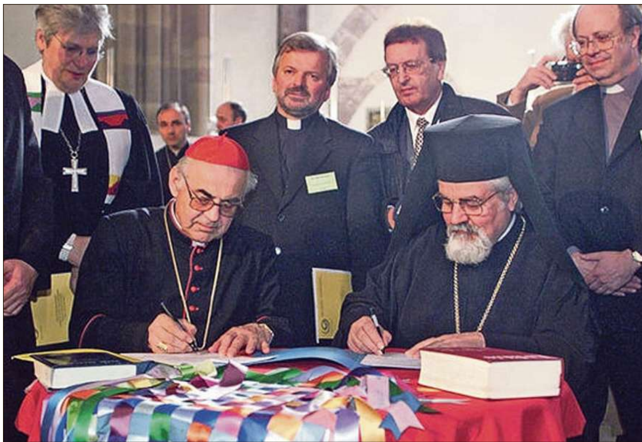
La Charta Oecumenica è vegnida sutscritta l'onn 2001 dals representants da las baselgias europeicas a Strassbourg.

■ Sco Conferenza da baselgias europeicas (CBE) e sco Cussegl da las conferenzas episcopalas europeicas (CCEE) essan nus en il spiert da las duas grondas radunanzas ecumenicas europeicas da Basilea e da Graz fermamain decis da mantegnair e da sviluppar la cuminanza ch'è creschida tranter nus. Nus engraziain a noss Dieu trinitar ch'el maina noss pass tras ses sontg Spiert ad ina cuminanza adina pli intensiva. Differentas furmas da collavuraziun ecumenica èn già sa cumprovadas. Ma nus na dastgain betg ans cuntentar cun la situaziun actuala sche nus vulain restar fidaivels a l'uraziun da Jesus: «Tuts duain esser unids: Sco che ti, Bab, es en mai e jau sun en tai, duain er els esser unids, per ch'il mund craja che ti m'has tramess!» (Jo 17, 21). Conscients da nossa culpa e pronts da'ns convertir duain nus ans impegnar da superar las separaziuns che existan anc tranter nus per che nus possian ensem en maniera credibla annunziar la buna nova da l'evangeli tranter ils pievels.